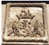
Les armes des Biencourt, conservées au château de Mesnières-en-Bray (76)