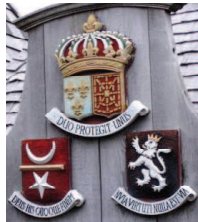
Les armes des Biencourt- Poutrincourt au Canada