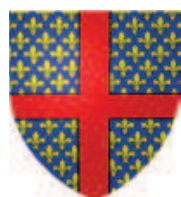
comtes-Archevêques de Reims