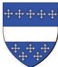
Saint-Omer - Morbecque